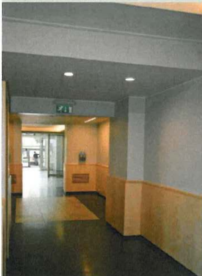
Un'altra immagine, con il posizionamento degli apparecchi