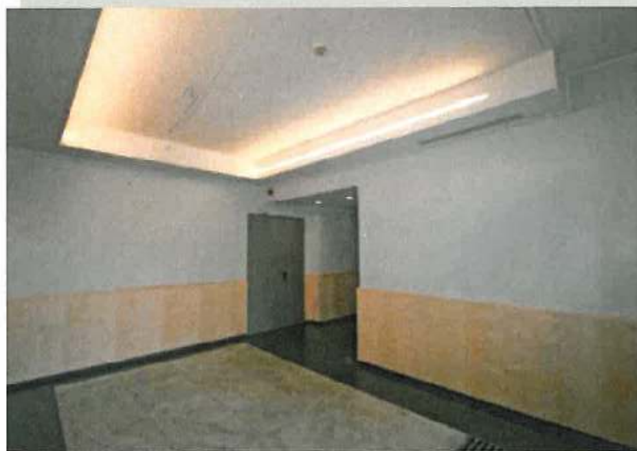
Sede Techint. In evidenza, la soluzione installativa del taglio lineare

Sono state poi prese in considerazione altre due soluzioni possibili, una prima con apparecchi solo LED, e una seconda con luce fluorescente + alogena, sulle quali abbiamo fatto un confronto